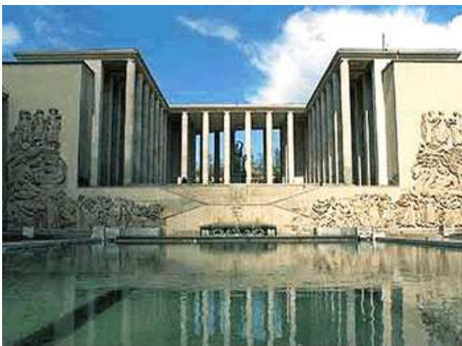
Palais de Tokyo, Paris

La seconde visite s'est tenue au MAM (Musée d'Art Moderne, Palais de Tokyo). Un guide conférencier a permis au groupe de découvrir quelques œuvres marquantes du début du XXe siècle et surtout de comprendre le renouveau qui s'opère à travers quelques artistes comme Picasso, les cubistes et fauvistes, R. Delaunay et Léger, l'art abstrait. Un arrêt particulier sur les œuvres de l'Italien Giorgio De Chirico a permis de rappeler le travail de recherche effectué en classe courant décembre. Les élèves ont également apprécié de pouvoir s'étonner et réagir devant des œuvres plus contemporaines (Boltanski, Baselitz). Certains ont été éblouis par la salle consacrée à l'œuvre monumentale de R. Dufy, La Fée Electricité .